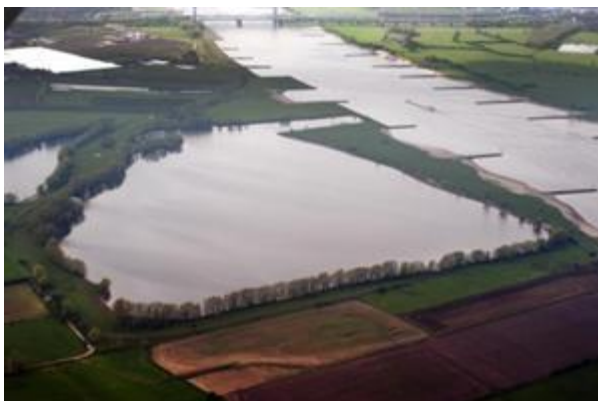
De Kil van Hurwenen

Als eigenaar van de grond mag je de visrechten verhuren. Zo komt hengelsportvereniging Nieuw Leven aan de visrechten. In het verhuurcontract staat heel precies waar de visrechten gehuurd worden.